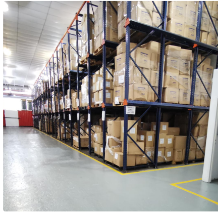
PASILLO PANORÁMICO · DEMARCACIÓN OPERATIVA