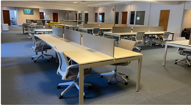
ESPACIOS DE COWORKING