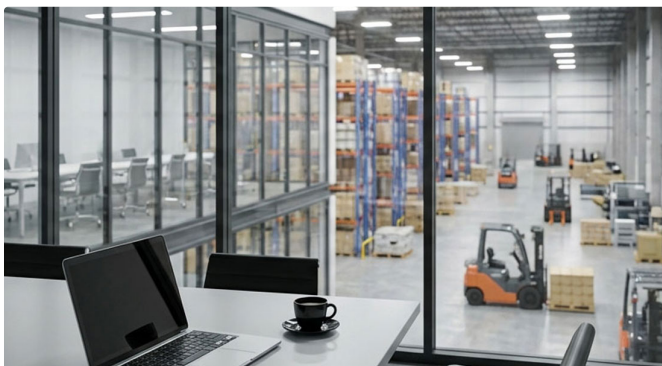
OFICINA PREMIUM · VISTA AL DEPÓSITO