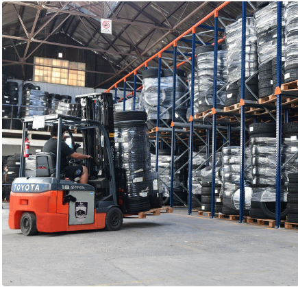
NAVE PRINCIPAL · RACKS MECALUX